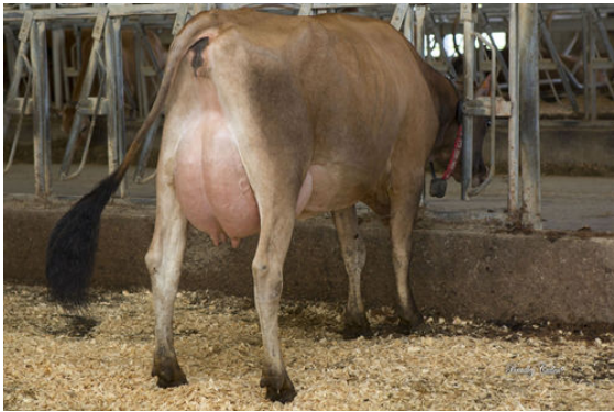
GOFF PHAROAH CIRCUS ACT THIRD DAM