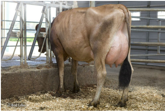
GOFF PHAROAH CIRCUS ACT THIRD DAM